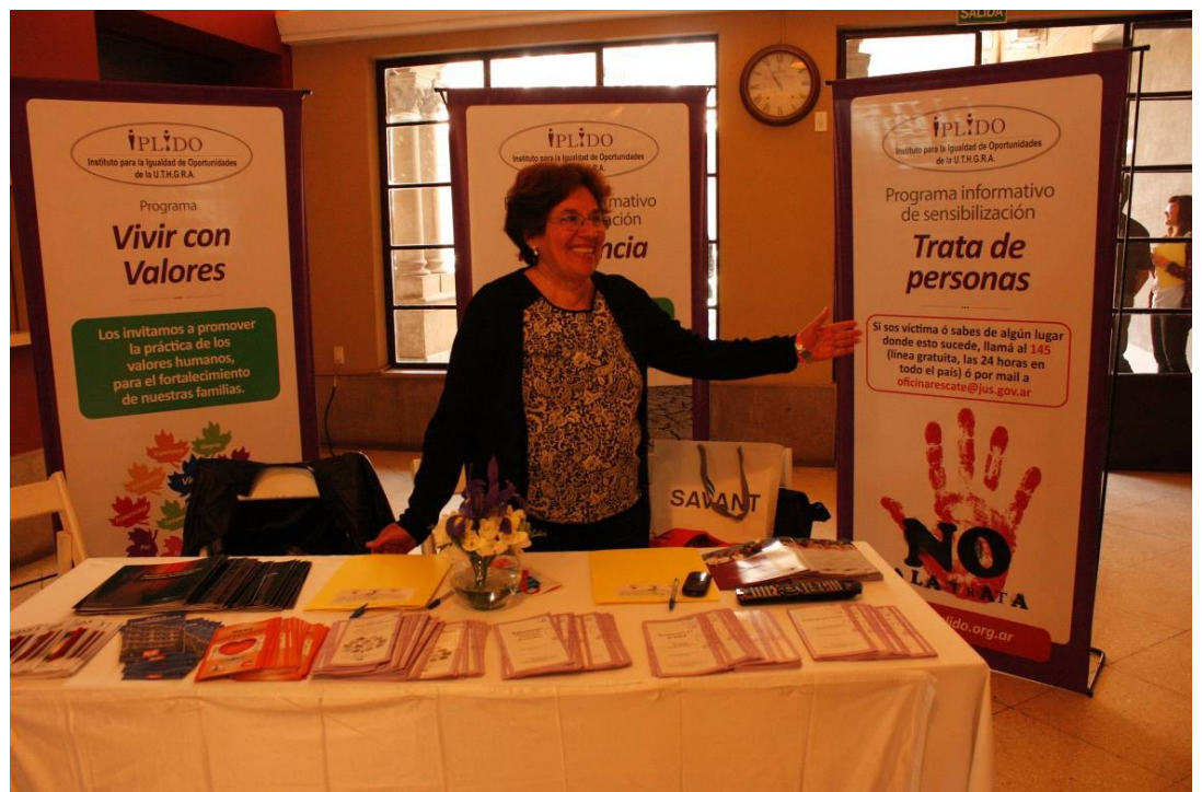
Stand Instituto IPLIDO – Sindicato de Gastrónomos