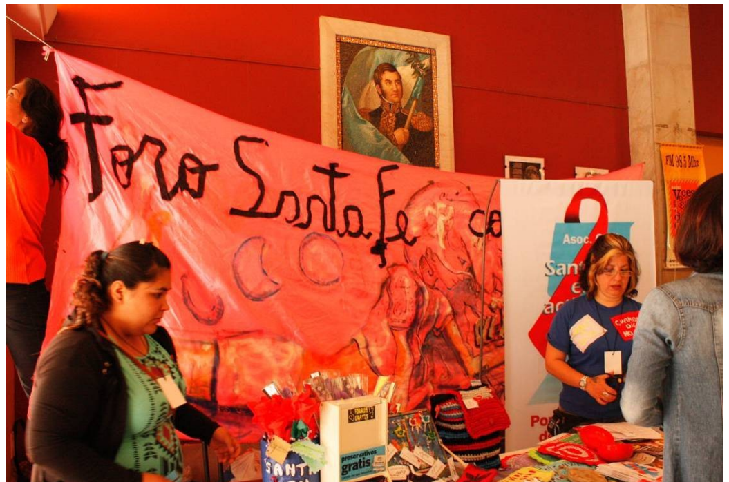
Stand Foro Santa Fe contra la Trata