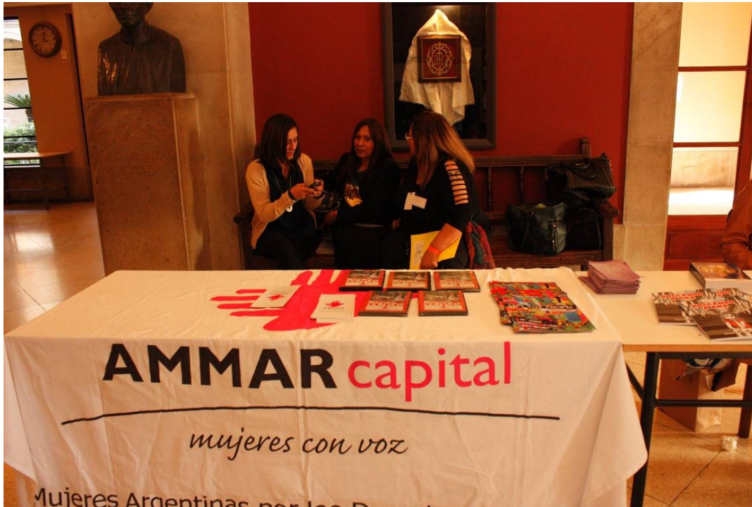
Stand Asociación Mujeres Argentinas por los Derecho Humanos