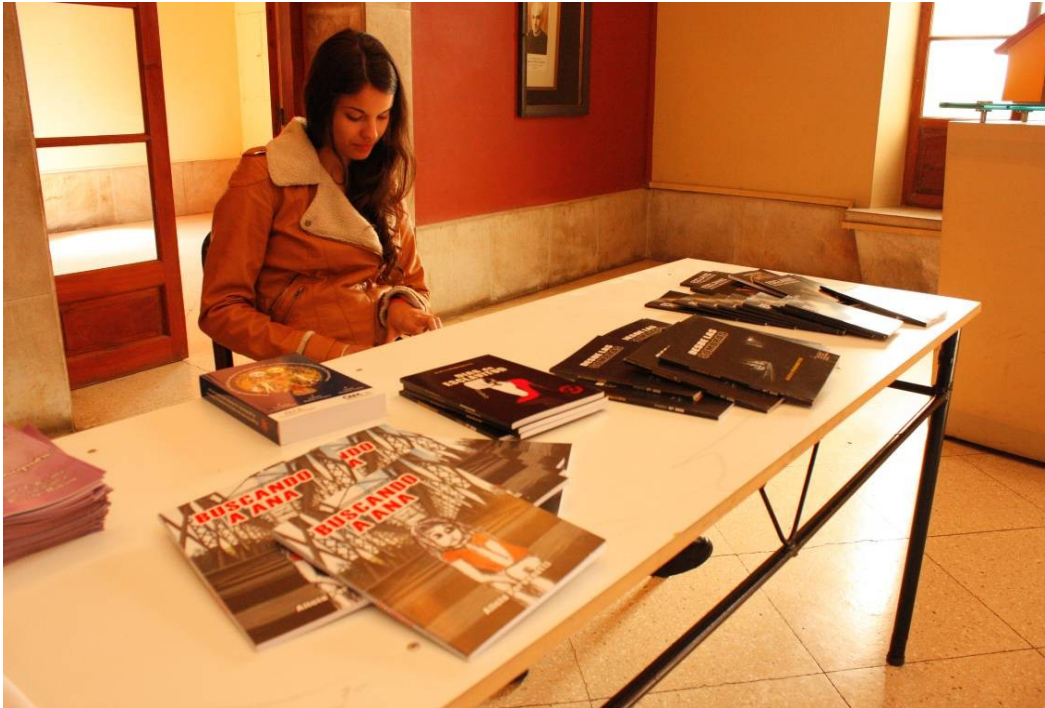
Stand Asociación Vínculos en Red