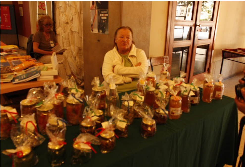
Stand Asociación Feriantes y Artesanos de Arroyo Leyes