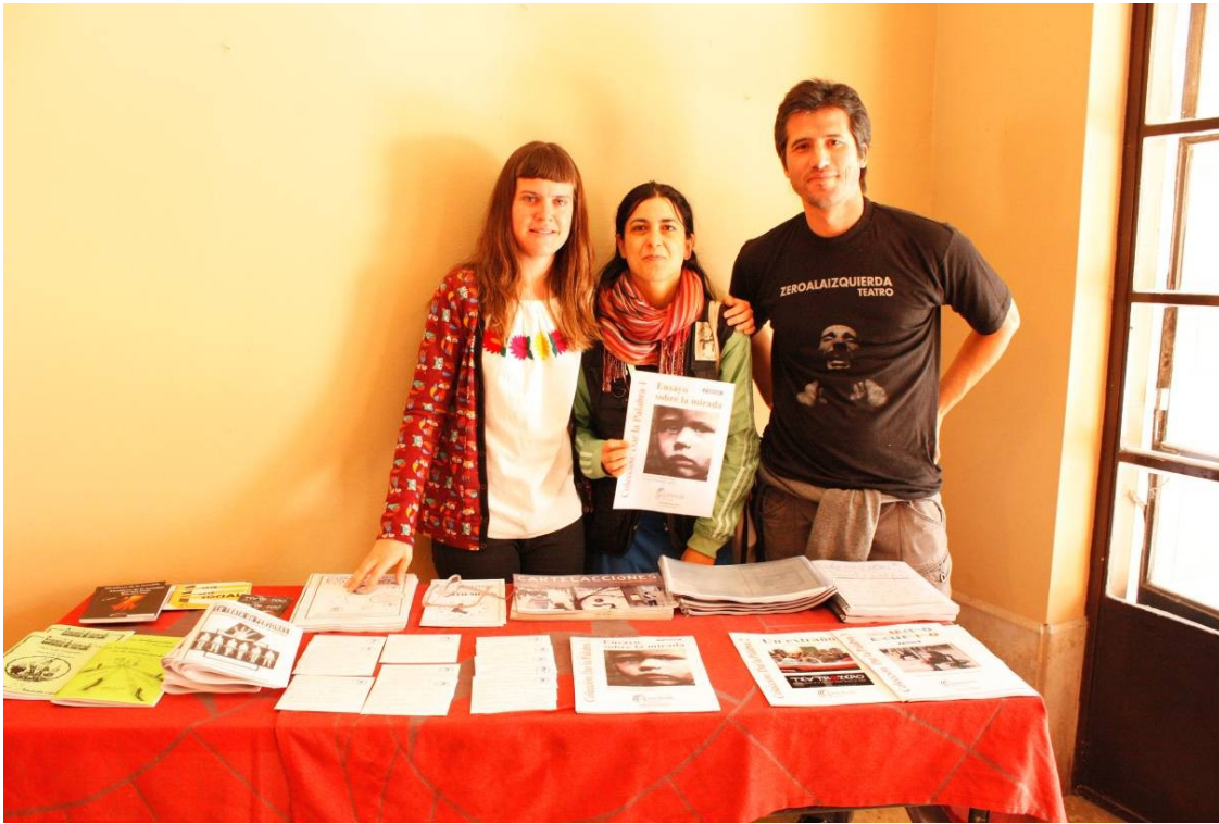
Stand Teatro Los últimos