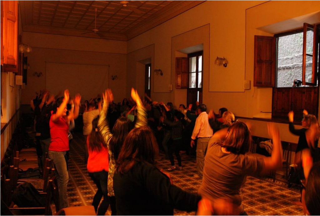
Taller de Mapeo colectivo