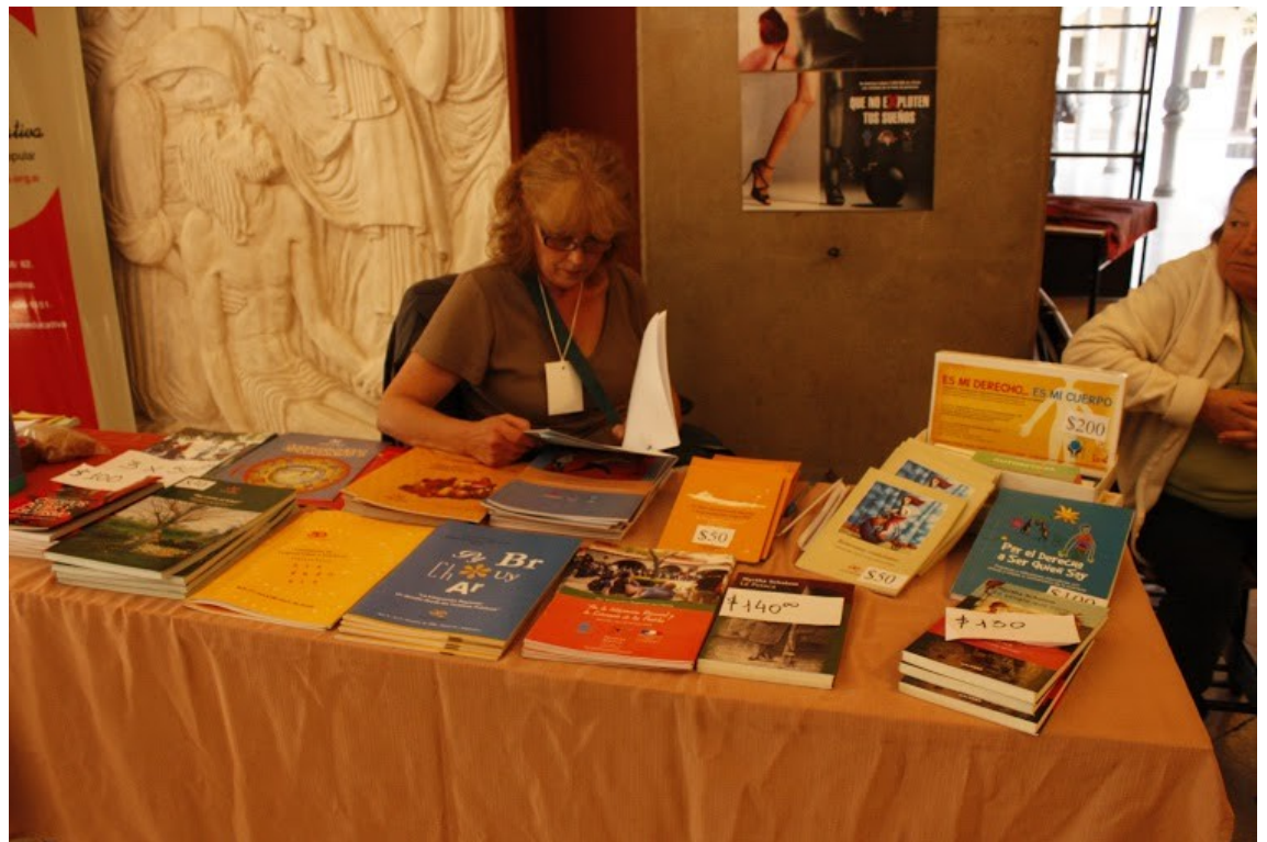
Stand Acción Educativa Santa Fe